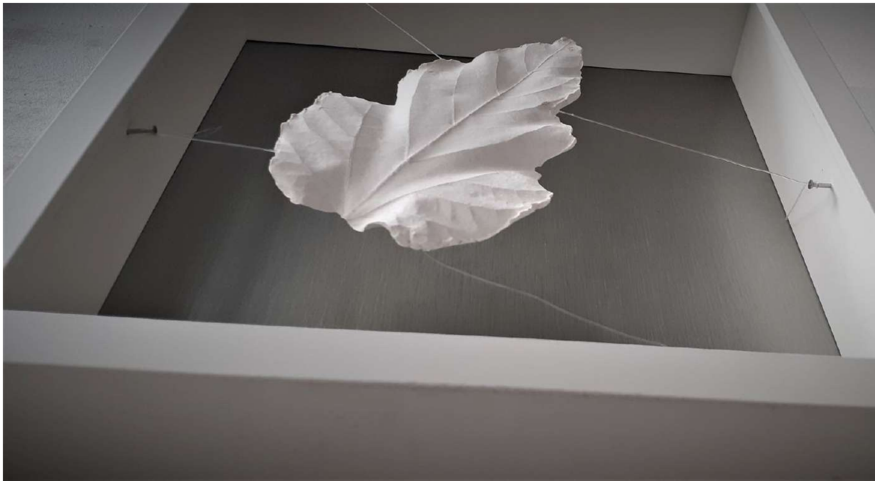
Feuille 2022-10-29 2022 - plâtre - 14 x 10 x 1 cm (cadré : 27 x 27 x 6 cm)