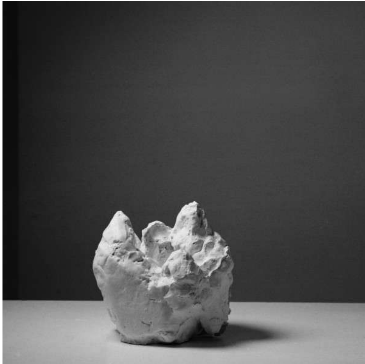
Bouton de nénuphar 6 2017 plâtre 18 x 18 x 18 cm