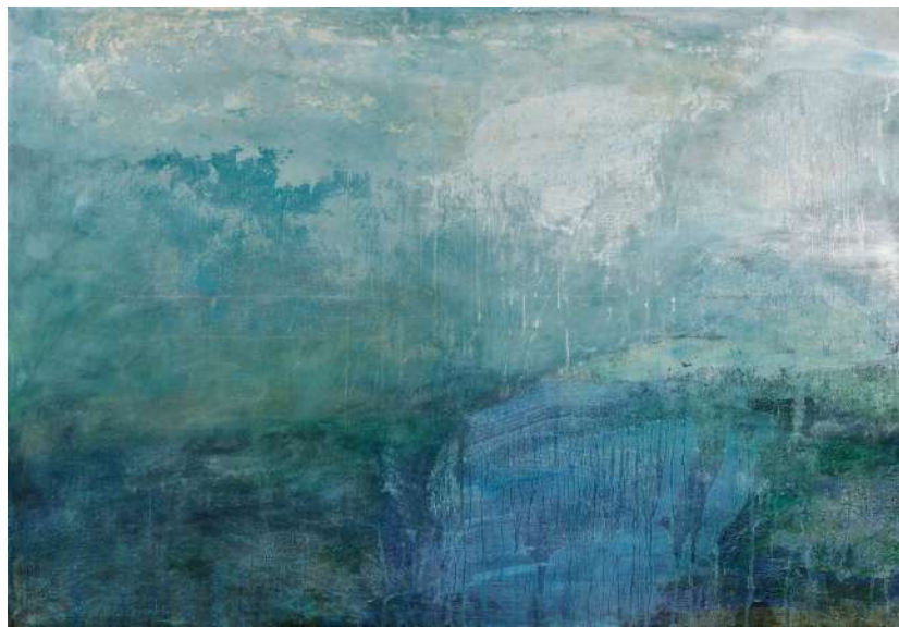
Précipitations 1997 peinture à l'eau et plâtre 89 x 130 cm

Ces images rappellent au spectateur ses rêves les plus intimes et révèlent les aspirations qu'il porte en lui.