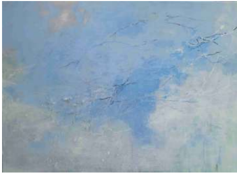
Bois de Montquincy

Nao Kaneko considère chaque peinture comme une sculpture : un objet en trois dimensions, une toile, un panneau de bois ou un papier qui existent dans l'espace que l'on partage. C'est ce sentiment qu'elle éprouve quand elle choisit, alors qu'elle est encore au Japon, le tissage plutôt que la teinture. Ce qui l'intéresse n'est pas de créer une illusion sur la surface de la toile, mais de fabriquer une œuvre tangible.