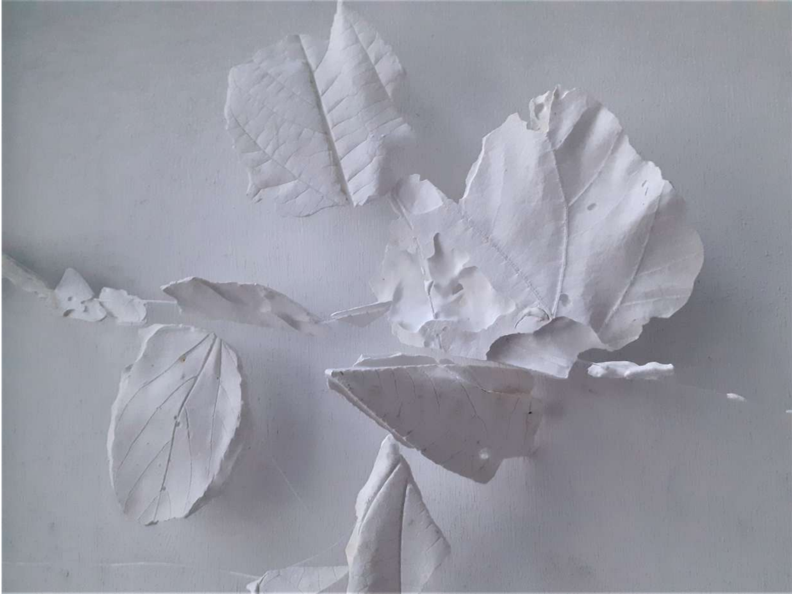
Feuille éclatée 2022 plâtre 32 x 42 x 7 cm