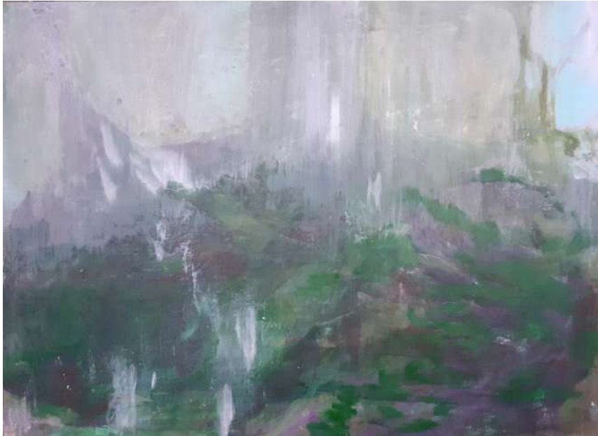
Forêt - clairière 2022 peinture à l'eau et à l'huile et plâtre 54 x 73 cm

En 2021, chez mes amis dans la région de la Touraine, un vieux cèdre a été abattu pour une raison de sécurité car il pourrait plus tard nuire à l'environnement. Il était très haut et dominait le parc. La propriétaire et ses amies japonaises ont organisé une cérémonie du thé en son honneur, le matin même. Dans l'odeur fraîche du bois, j'ai réalisé des aquarelles afin de mémoriser l'impact de la destruction.