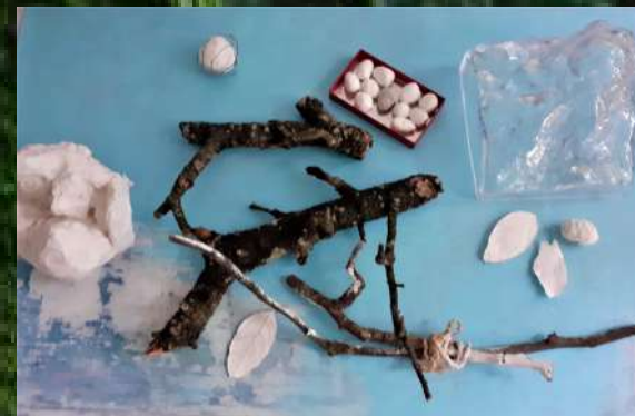
Empreintes dans la forêt 2022

Mes pensées concrètes, dont certaines intimes de ma vie, se sont manifestées autrement que dans la peinture ou la sculpture. L'exposition « Imaginer une forêt » est la continuité et l'approfondissement de mes thèmes tels que : rêve de la forêt, vivre sur une planète, respirer entre le Japon et la France et les archives photos de ma famille.