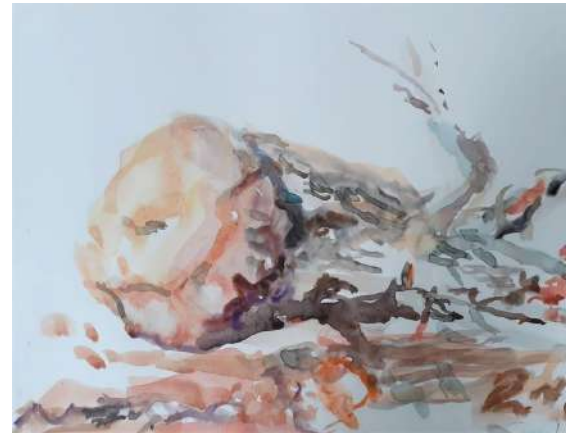
Cèdre du Liban abattu 2021 aquarelle 28 x 35.5 cm

Ces éléments de la nature ont tellement de présence et d'énergie vivace, ils ne se laissent pas facilement intégrer dans une œuvre d'art et me font réfléchir. Lors de ma performance, ces branches emballées dans un papier recyclé et un papier de soie bleu ont été déballées devant les spectateurs.