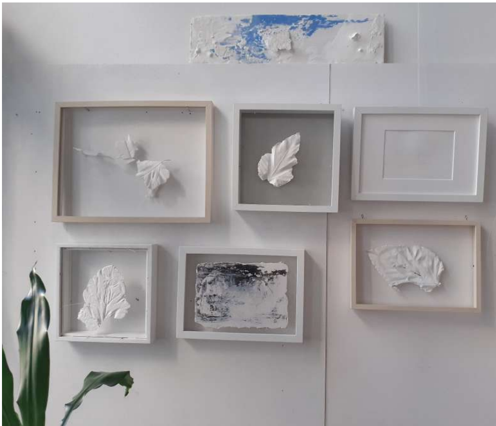
Feuille sur l'eau - 2022 - plâtre, peinture à l'eau, pastel sur bois