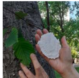
Empreintes dans la forêt performance dans les parcs 2022 plâtre