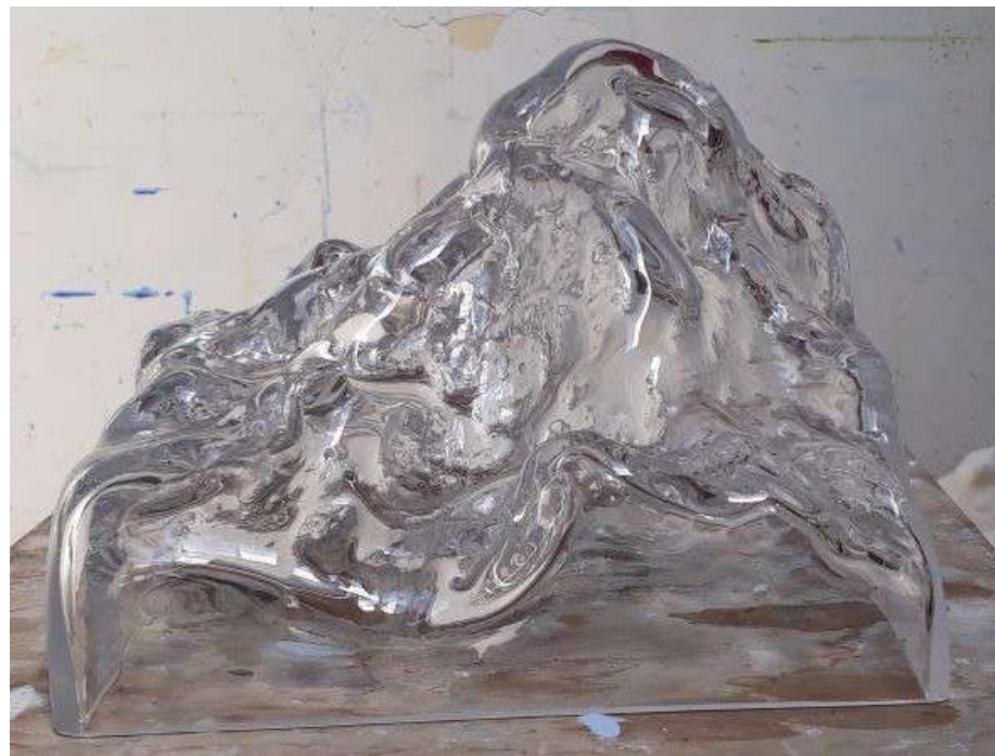
Un carat de montagne 2018 verre 16 x 20 x 20 cm