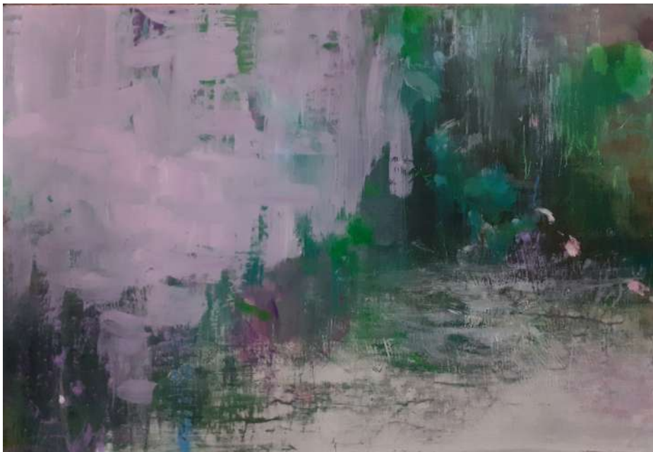
Forêt – tulipes noires 2022 peinture à l'eau et à l'huile, pastel et plâtre 38 x 55 cm