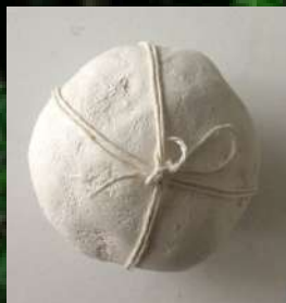
Boule 2022 plâtre et ficelle 8 x 8 x 8 cm

peinture sur toile, sculptures en verre, plâtre, bois, ficelle, fil de fer.