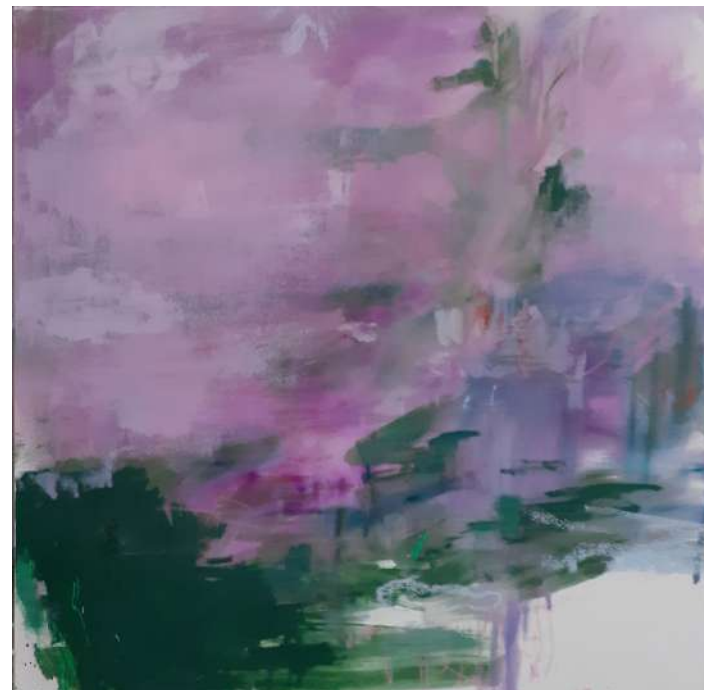
peinture à l'eau et à l'huile, pastel, crayon et plâtre 80 x 80 cm