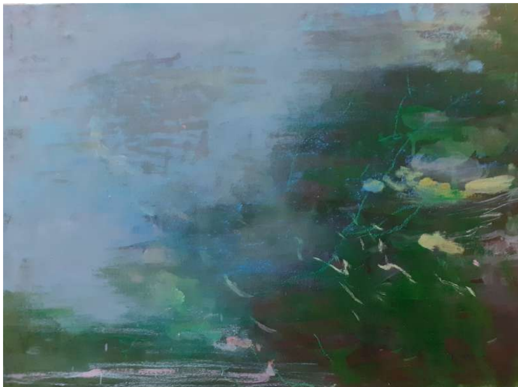
Forêt - étang 2022 peinture à l'eau et à l'huile, pastel et plâtre 54 x 73 cm